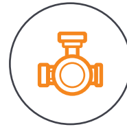
Dreiaxsig stabilisierter Gimbal