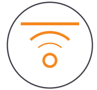
150m Effektive Beleuch- tungsentfernung