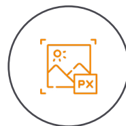
2 µm Pixelgröße